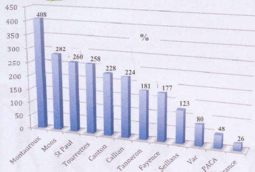
Evolution démographique en % entre 1968 et 2008 (source Insee)