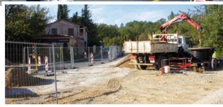
Les travaux de la sortie de Saint-Paul-en-Forêt