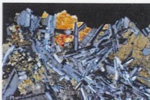
V.2014 - Minéraux vus au microscope